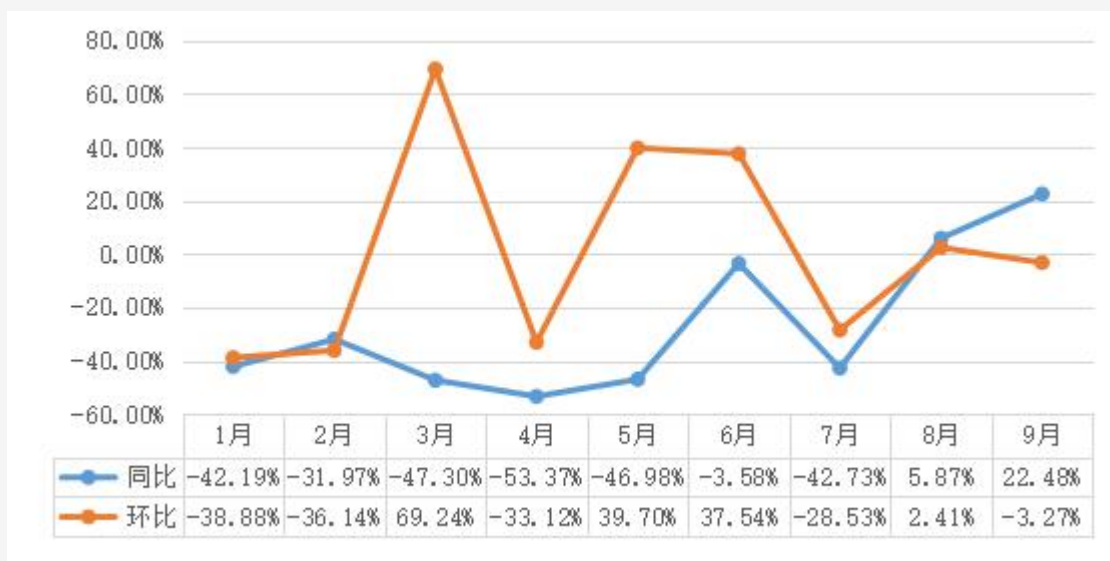
2022年1-9月佛山市新建商品住房成交面积同比环比走势