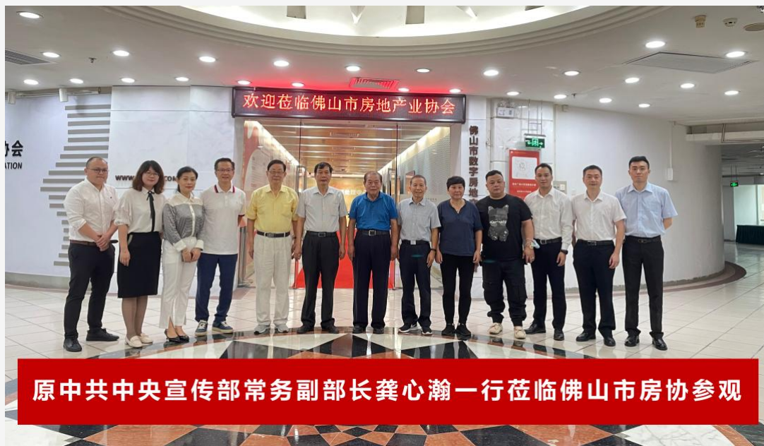
原中共中央宣传部常务副部长龚心瀚一行莅临佛山市房协参观

今后，佛山市房协将继续做好政府与行业、社会与企业的桥梁纽带，提升线上线下多维服务质量，持续为行业、为企业赋能增效，服务行业、服务政府、服务企业、服务市民。